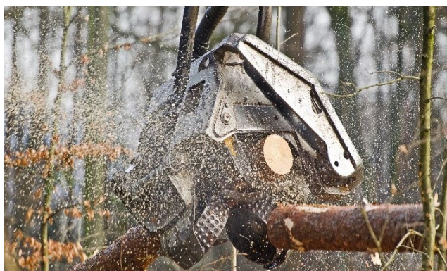
Exemples d'application machines de récolte du bois

La bobine interchangeable simplifie considérablement la logistique, car la bobine électro-magnétique peut également être installée ultérieurement. Grâce aux différentes variantes, les cartouches à visser proportionnelles sont devenues un système très flexible. Différentes variantes de connecteurs et de tension sont disponibles en stock et sont complétées par la flexibilité habituelle de Wandfluh en ce qui concerne les adaptations individuelles.