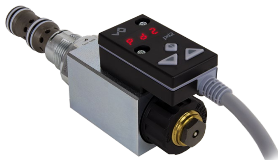
Auf Magnet MP